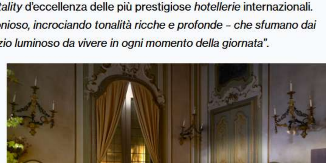
NEUTRA, Monochrome Affinity, The Lounge. Photo Leonardo Duggento