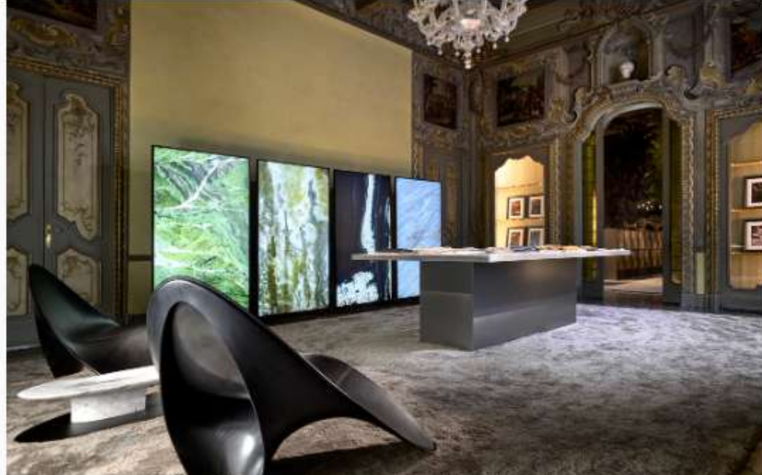
NEUTRA, Monochrome Affinity, Atelier NEUTRA.

Al fine di creare un ambiente intimo, il disegno della luce nello spazio "è stato sviluppato lavorando principalmente con la luce naturale - libera di invadere gli ambienti e modulare i colori a seconda dei diversi momenti della giornata - e la luce puntuale degli spot LED, dal calibrato effetto scenico, in dialogo con i toni caldi delle lampade NEUTRA integrate agli ambienti. Il risultato è uno spazio suggestivo, in cui la densità e la divergenza cromatica del marmo in dialogo con la luce e il disegno degli arredi contribuiscono a definire uno scenario abitato ricercato e avvolgente". Luce su cui NEUTRA lavora da sempre.