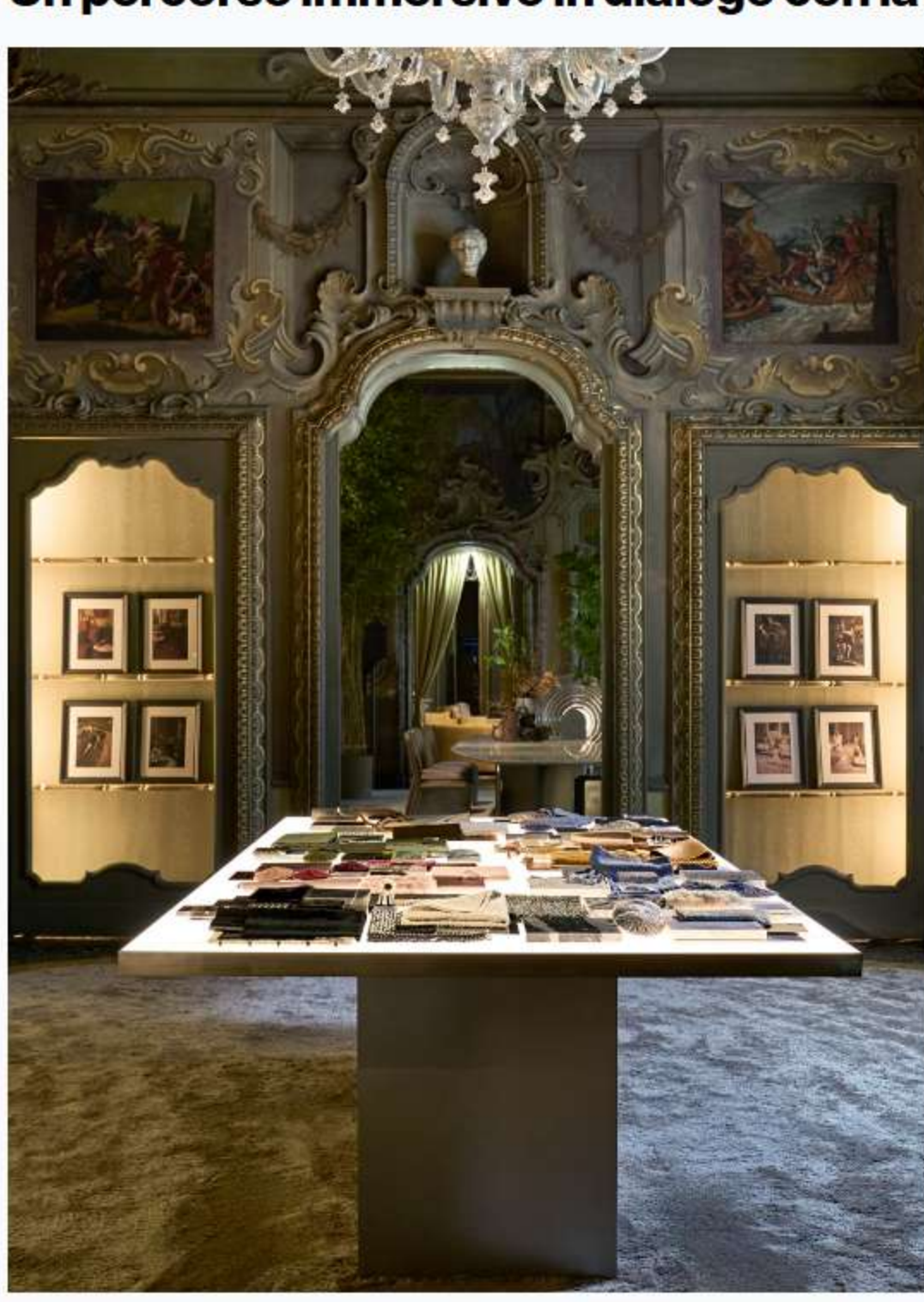
NEUTRA, Monochrome Affinity, Atelier NEUTRA.

L'installazione, che si presenta come un percorso espositivo attraverso le sale dello storico palazzo trasformate in ambienti arredati, mette in scena vecchi e nuovi prodotti e collezioni inedite in un concept che si evolve rispetto allo scorso anno, "in una coerenza di continuità di ispirazione e valori. Ne deriva un viaggio immersivo nell'identità del brand, nel suo savoir-faire e nella sua espressione progettuale, e nell'universo cromatico delle pietre naturali, assolute protagoniste della narrazione, che dialogano nella scenografia per affinità o armoniosi contrasti".