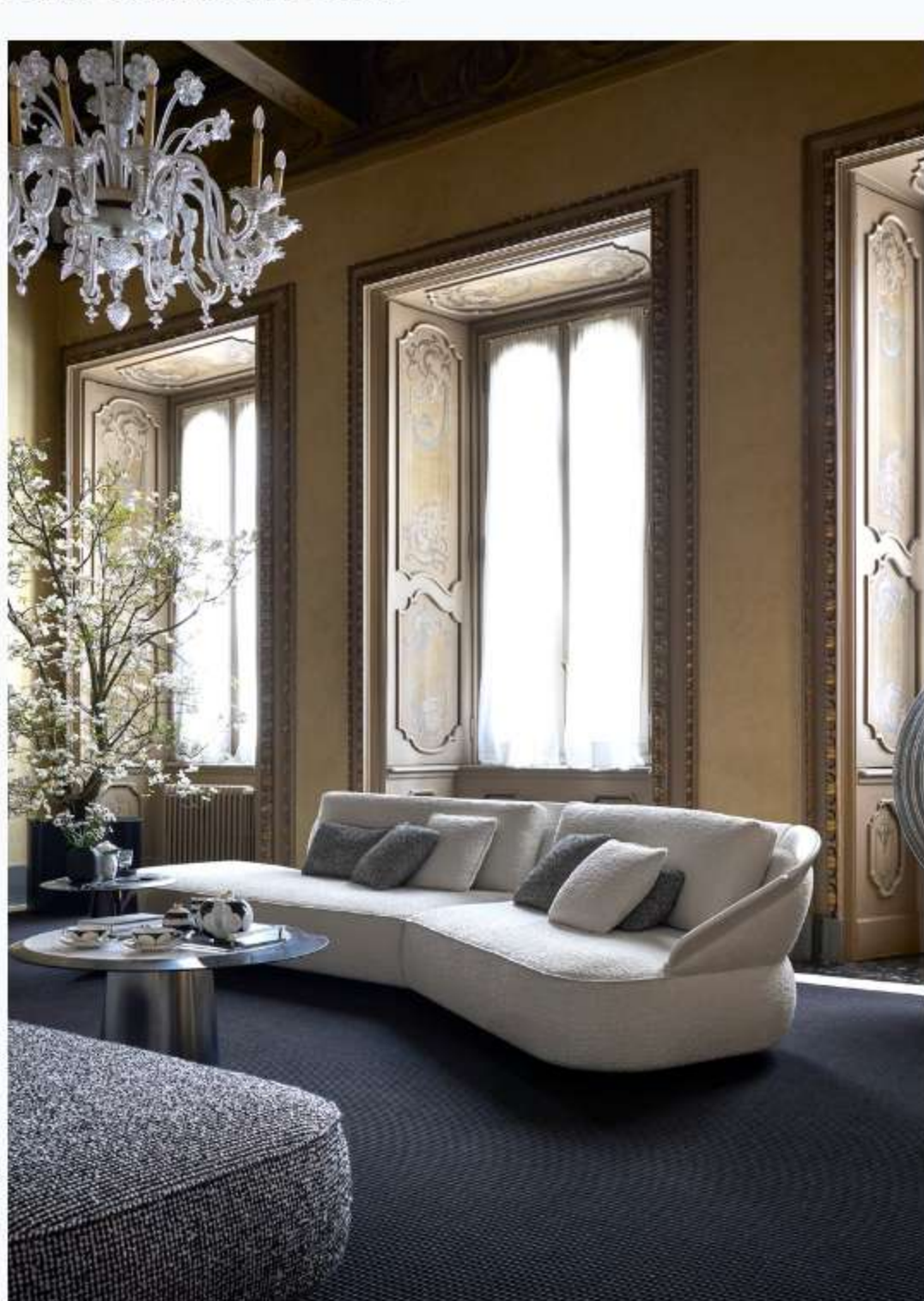
NEUTRA, Monochrome Affinity, The Living Room.

Si passa quindi nell'area living - The Living Room , uno spazio definito da un "ponderato gioco di contaminazioni e contrasti tra il bianco etereo del pregiato marmo Lasa e gli eleganti grafismi del nero Eclipse e Grand Antique". Tra gli arredi spicca la lampada da tavolo Strobilo in Bianco Sivec di Migliore+Servetto , un mix tra solidità e leggerezza, tra la matericità della pietra e la trasparenza del vetro, la cui forma richiama il vortice dell'acqua che modella la roccia nel tempo. La luce emerge delicatamente dal basamento per rifrangersi nel disco superiore e sembra sospendere il materiale, rendere il marmo leggero. Leggerezza che, d'altra parte, è un segno distintivo di NEUTRA.