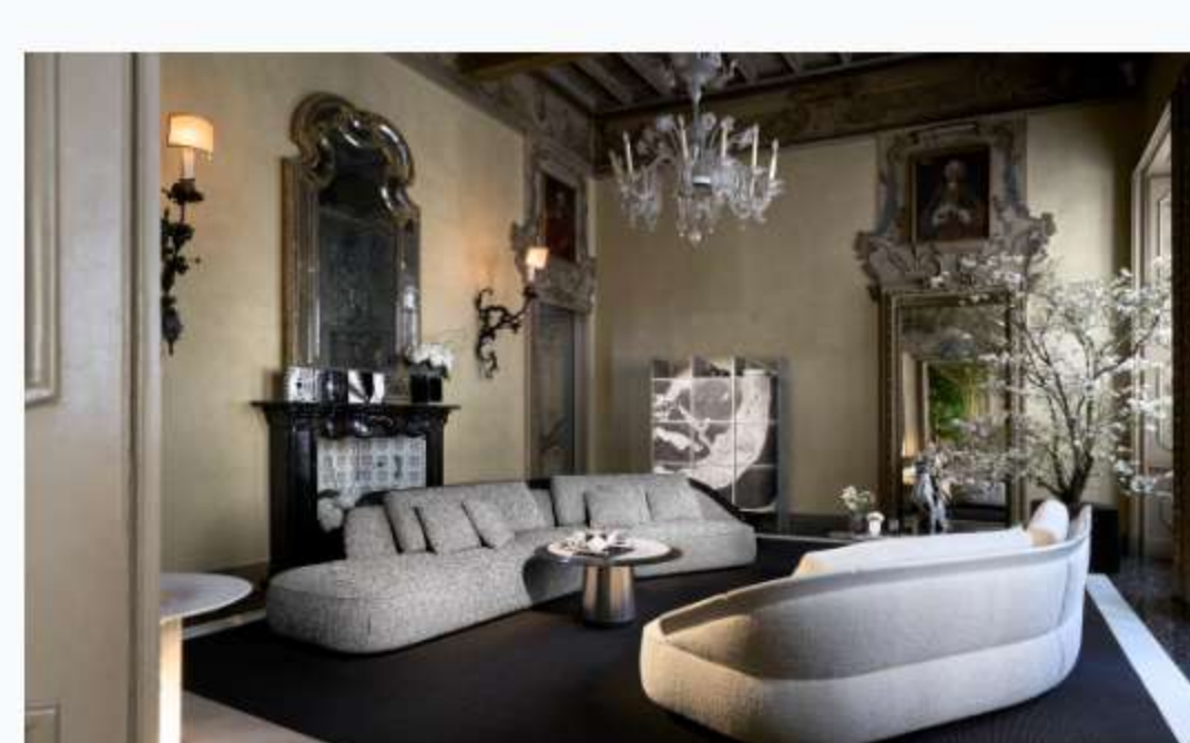
NEUTRA, Monochrome Affinity, The Living Room.

Il concetto Unique by NEUTRA si esprime pienamente in The Great Hall nel salone principale, un unico grande ambiente che coniuga una zona living e un'area dining , nell'accordo delle tonalità morbide del Travertino bianco nuvolato e della Quarzite Taj Mahal con le trame boschive dell'Onice Oliva e i numerosi elementi vegetali. Nella zona Living sono esposte due Strobilo da tavolo in Verde Tifone, mentre lungo le pareti si trova una grande lampada Lente in Travertino bianco nuvolato nella versione da terra, sempre di Migliore+Servetto , un grande occhio di luce che "esplora" lo spazio distinguendosi per la purezza del segno e per il suo effetto etereo. "Il risultato è un interno raffinato che si apre a una dimensione naturale più selvaggia, quasi fuori controllo: una natura che filtra, cresce e si insinua tra le superfici, portando con sé umidità, calore, ombra e luce".