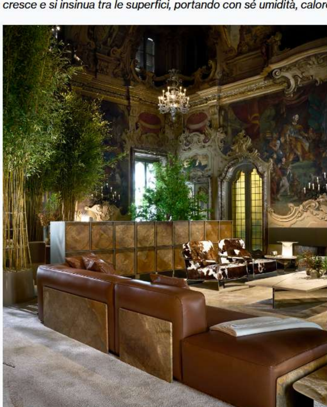
NEUTRA, Monochrome Affinity, The Great Hall.

Il concetto Unique by NEUTRA si esprime pienamente in The Great Hall nel salone principale, un unico grande ambiente che coniuga una zona living e un'area dining , nell'accordo delle tonalità morbide del Travertino bianco nuvolato e della Quarzite Taj Mahal con le trame boschive dell'Onice Oliva e i numerosi elementi vegetali. Nella zona Living sono esposte due Strobilo da tavolo in Verde Tifone, mentre lungo le pareti si trova una grande lampada Lente in Travertino bianco nuvolato nella versione da terra, sempre di Migliore+Servetto , un grande occhio di luce che "esplora" lo spazio distinguendosi per la purezza del segno e per il suo effetto etereo. "Il risultato è un interno raffinato che si apre a una dimensione naturale più selvaggia, quasi fuori controllo: una natura che filtra, cresce e si insinua tra le superfici, portando con sé umidità, calore, ombra e luce".