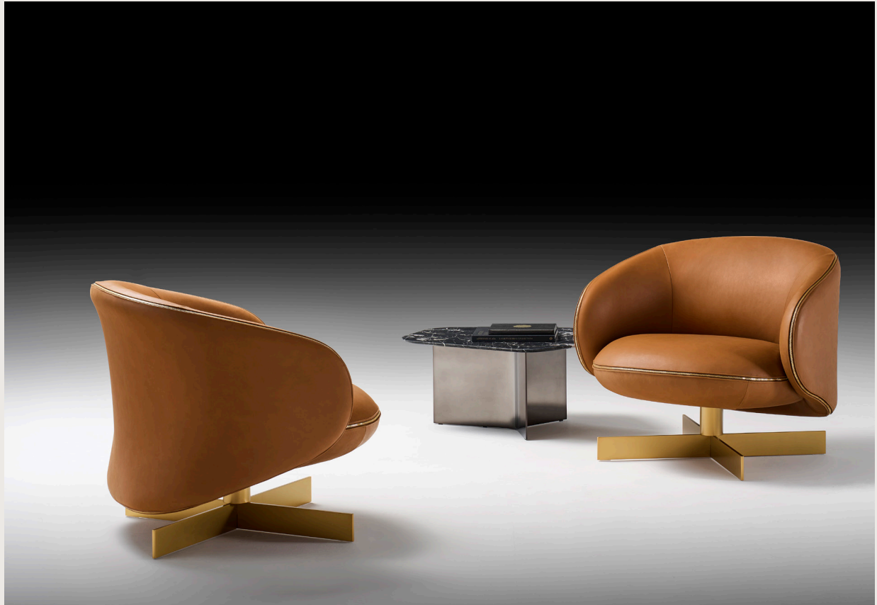
BIRKY Poltrona Pelle / Armchair Leather Pelle naturale Nuvolato Opaco Gold Natural Leather Matt Cloudy Gold